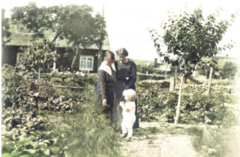
Bild 2. Samma hus i bakgrunden som på bild 1.