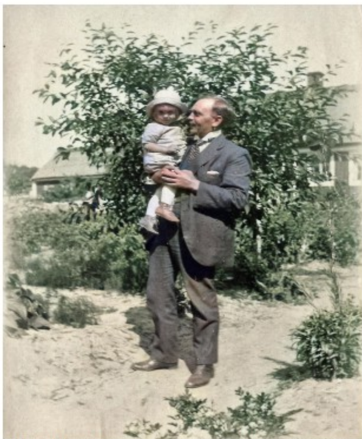
Bild 3. Kaféet till höger och Piltvägen 7 i bakgrunden till denna bild. Även det huset finns kvar.