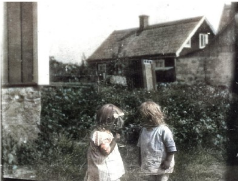
Bild 5. Här är barnen i samma hörn av kaféträdgården, husen i bakgrunden är vinkeldelen av huset på Strandvägen 22 till höger. Baksidan på Strandvägen 20 ses i mitten, och förstas änden på kaféhuset till vänster.